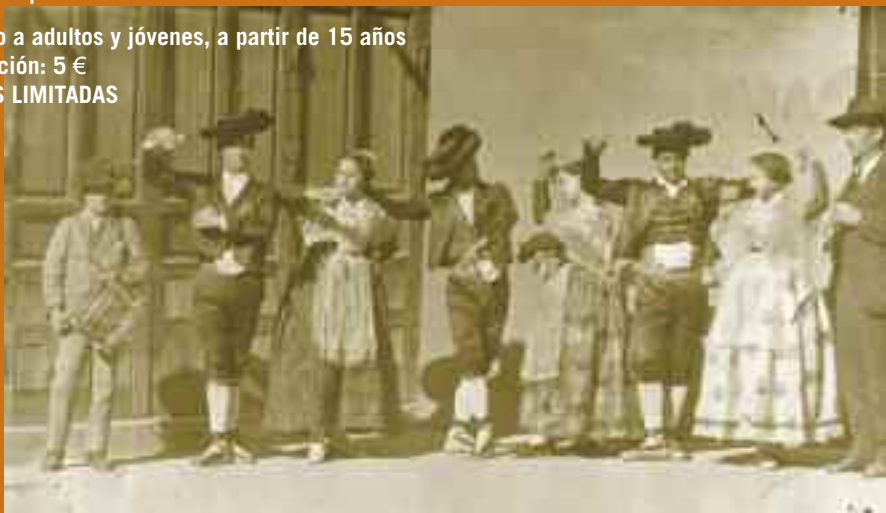
Grupo de paisanos de Castellón. 1924.

Dirigido a adultos y jóvenes, a partir de 15 años Inscripción: 5 € PLAZAS LIMITADAS