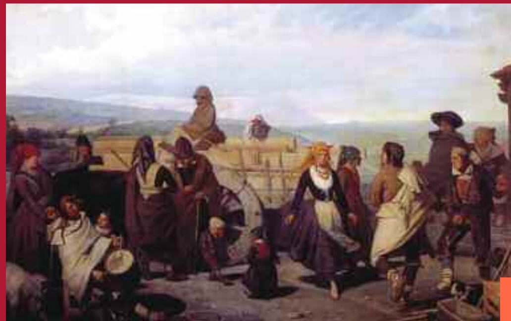
"El Baile" ("La Carreta") (1866). Óleo sobre lienzo de Valeriano Domínguez Bécquer (Museo Nacional del Prado)

Además, se tendrán en cuenta también otros aspectos, como la indumentaria tradicional como medio determinante en la danza y el baile, los ritmos básicos españoles a través del aprendizaje con instrumentos de percusión, las danzas rituales, las canciones, etc., presentándose con un enfoque didáctico para su posterior aplicación educativa. ¿Te animas?