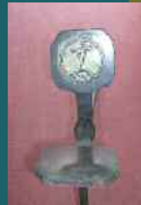
Nieblero español del siglo XVIII procedente de Ourense (en comercio)

Medidas: 76,5 cm de long. Planchas de 10 x 19 cm, determinando dos hostias de 7,5 cm de diámetro y otras dos de 2 cm con cruces latinas inscritas. Argolla elipsoidal de cierre en uno de los extremos del hostiario –perfila un semicírculo– de 10,5 cm de long. encajable en seis dientes hendidos en el otro extremo. Para su clasificación exhaustiva podríamos recurrir a otras piezas existentes en las colecciones del Museu Marès de Barcelona y del Museu Etnogràfic de Navarra , amén de otras piezas subastadas en febrero de 2007 (lotes nº 957-958, Fernando Durán, Madrid).