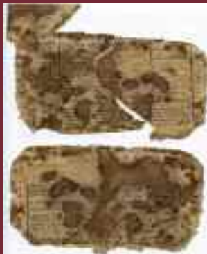
Fragmentos de papel con horarios de seminaristas aprisionados entre las valvas del nieblero

Parece factura de fines del siglo XIX procedente de alguna parroquia o convento. Aprisionados en el interior de las planchas aparecieron varios fragmentos de papel con horarios impresos de los alumnos internos y externos de un Seminario (¿tal vez el Conciliar de San Atilano de Zamora?), presentan numerosas huellas de óxido, los fragmentos se adjuntan a la pieza.